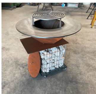
La « brasebion », mi-brasero mi-gabion réalisé par la métallerie MF2S.