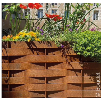
Un bac à fleurs réalisé par la métallerie Bouclet à l'abbaye de Vendôme (41).

anciennes, par exemple. Aujourd'hui, le marché peut se compartimenter en plusieurs grands créneaux :